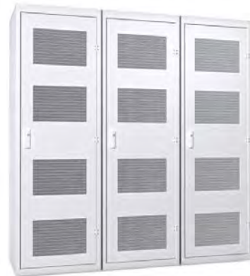
Lithium-ion батарейные шкафы